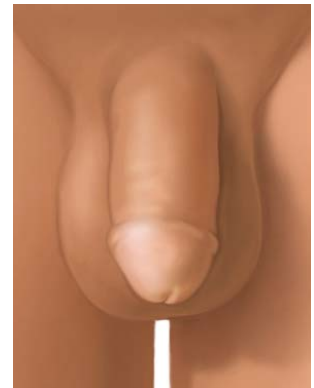
Se extirpa el prepucio.